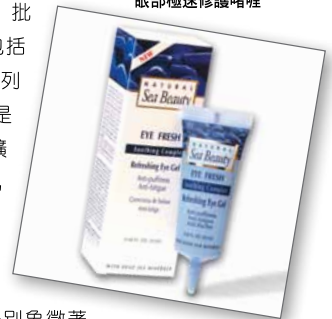
Natural Sea Beauty 眼部極速修護啫喱

來自澳洲的 Kosmea 系列以玫瑰果油為主要成分。Kosmea 於古希臘文中代表「和諧、均衡」，而這正是玫瑰果油的特性。玫瑰果油含有豐富維他命、抗氧化物及脂肪酸，為肌膚提供充足養分，產品更曾被 Cosmopolitan、InStyle 及 Marie Claire 推介。來自韓國的人氣品牌「澄肌美」系列有多款面膜，包括骨膠原面膜、速效止痘去印面膜、溫泉保濕活膚面膜及人蔘美白保濕面膜等。