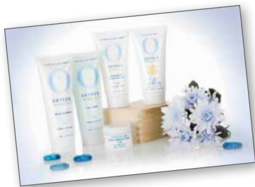
Oxygen Botanicals 純氧護膚系列

Oxygen Botanicals 受到 HotCha 及樂壇新人鄧芷茵支持，鄧芷茵更把家裡護膚品全部換成該系列。她認為人體皮膚最需要氧分，這個系列能加速肌膚新陳代謝，改善暗啞及缺水問題，令上妝更貼面，並改善偏黃膚色。