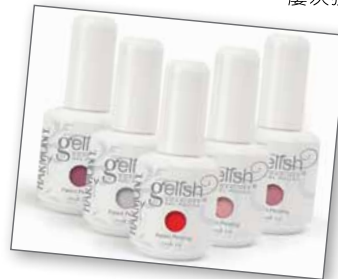
Hand & Nail Harmony Gelish Soak Off Gel

T-Nail 不單售賣美甲用品，更提供美甲服務和開辦美甲學院，其美甲學院是多個國際機構的認可考試中心，導師團隊屢次獲邀為本地及海外大型美甲賽