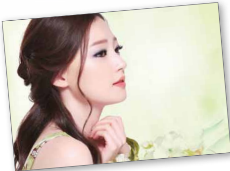
展現愛自己、充滿熱情及時尚的獨特美態，為 MISSHA 的核心價值

剛踏入 11 周年的 MISSHA，為韓國 3 大最受歡迎品牌之一，2005 年於韓國正式上市。今天，品牌的足跡遍及全球廿多個國家，讓女士們得以展現愛自己、充滿熱情及時尚的獨特美態。MISSHA 除了多元化的產品以外，為提升品牌的專業形象，更早於 2006 年開始推行不同形式的化妝課程及服務，讓女士們對化妝有更深入的了解，並讓有志成為未來化妝師的學員踏上成功之路。MISSHA 近年更開辦了不同的國際認可課程，包括 City & Guilds 和 ITEC 化妝文憑等，令化妝課程國際化。