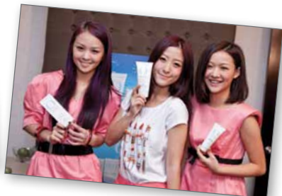
人氣女子組合 HotCha 也是 Oxygen Botanicals 的粉絲