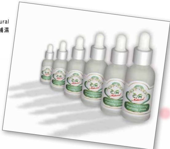
CYM Natural 全效淨白補濕 精華素

擁有 18 年歷史的卓意發展有限公司 (Crystal Mind Development Limited)，為大家誠意引見 CYM "Crystal" 晶凝系列、CYMplus 系列及 CYM Natural 系列，致力助你締造晶瑩剔透的美肌。CYM "Crystal" 晶凝系列乃專為亞洲肌膚而設的護膚品，選用珍貴而天然的成分，如硫蛋白還原酶、脫氧核醣核酸、竹萃取物、白玫瑰精華、馬尾草精華、人參萃取物、藏茴香、雪松等，可同時帶來美白與保濕功效。至於 CYMplus 系列，則備受皮膚專科醫生推崇，當中特別推介王牌產品——生長因子美白精華素及 DCX 抗皺眼部精華素，前者透過抑制皮膚產生酪氨酸酶以減少黑色素沉澱；後者則採用 DCX 專利配方，有效改善黑眼圈、眼袋及眼紋。而 CYM Natural 系列的全新產品全效淨白補濕精華素，全方位淨白補濕，經證實符合美國 FDA 之化妝品最高汞含量，及中華人民共和國之化妝品衛生標準，並獲得 "STC Tested" Mark 優質「正」印，品質之優，絕對有保證！