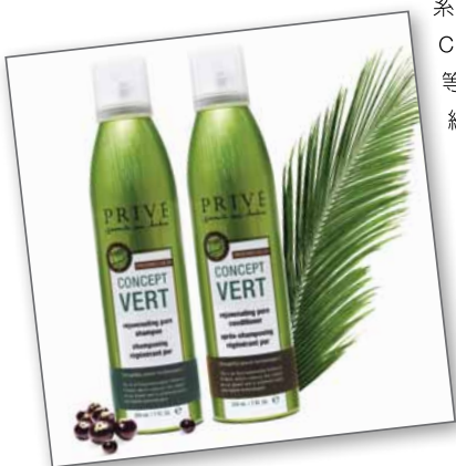
Privé Concept Vert 再生洗髮水 / 再生護髮素

雅高實業亦代理專業美甲品牌 CND (Creative Nail Design)。CND 是 New York Fashion Week 的常客，不單為多位模特兒打造驚艷指尖，其美甲預告亦是一大潮流指標。產品包括 SHELLAC、貝莎光療啫喱甲系列、手部和足部護理系列及香薰系列等，曾獲得 Bazaar、Cosmopolitan、Marie Claire、Vogue 等推介。最近，CND 更與曾為美國總統夫人米歇爾多次設計服裝的吳季剛 (Jason Wu) 合作，推出 crossover 系列；這組 CND for Jason Wu 的指甲油四個顏色和一瓶特效甲油，散發著春夏的粉嫩，優雅的氣質，不含甲醛、甲苯、DBP 三種有害的化學成份，讓指甲綻放色彩。